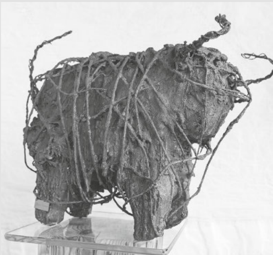
„Stier“ von Jaro Heim

Verfolgt werden kann das Kunstgeschehen im Ort auf der neu gestalteten Homepage allensbacherkunstler.de