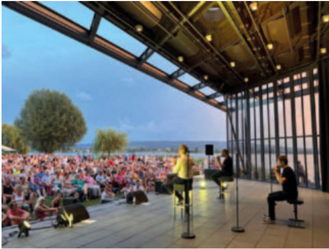
KULTUR am SEE-Bühne „Ein Ort für Bürger und Gäste“

Das im Juli 2023 eröffnete Montessori-Kinderhaus überzeugt durch seine Nachhaltigkeit und seine Flexibilität. Die vorwiegende Holzbauweise, die modulare Nutzung und die offene Gestaltung seien ebenfalls ein beispielhaftes Bauen im Landkreis.