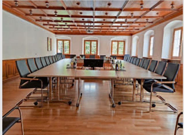
Sitzungssaal im Allensbacher Rathaus: Hier finden die Gemeinderats- und Ausschusssitzungen statt